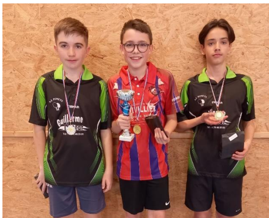
Podium cadets / juniors