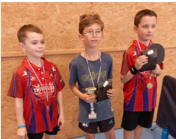
Podium benjamins / poussins