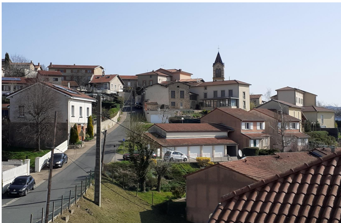
Vue du village à partir du toit de la salle des fêtes

Mairie 69610 SOUZY – Tél. 04 74 70 05 17 – mairie@souzy.fr - Accueil du public : lundi 14h-18h ; mardi 9h-12h ; jeudi 9h-12h ; vendredi 14h-18h Site internet : www.souzy.fr – Suivez-nous sur notre page Facebook et recevez toutes les infos sur Panneau Pocket