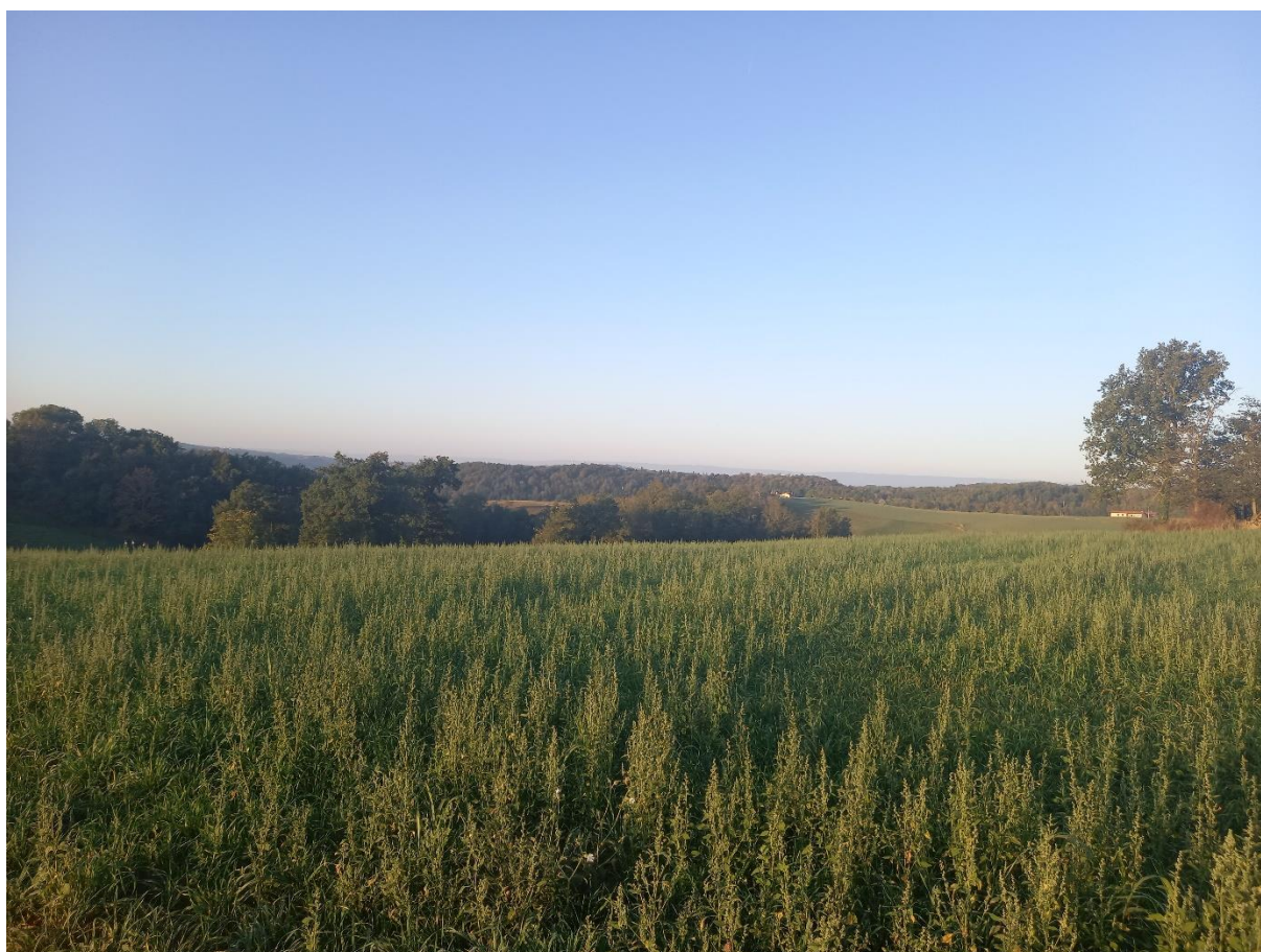
Vue matinale du haut de Souzy (RD633), côté Pinet.

Site internet : www.souzy.fr – Suivez-nous sur notre page Facebook et recevez toutes les infos sur Panneau Pocket