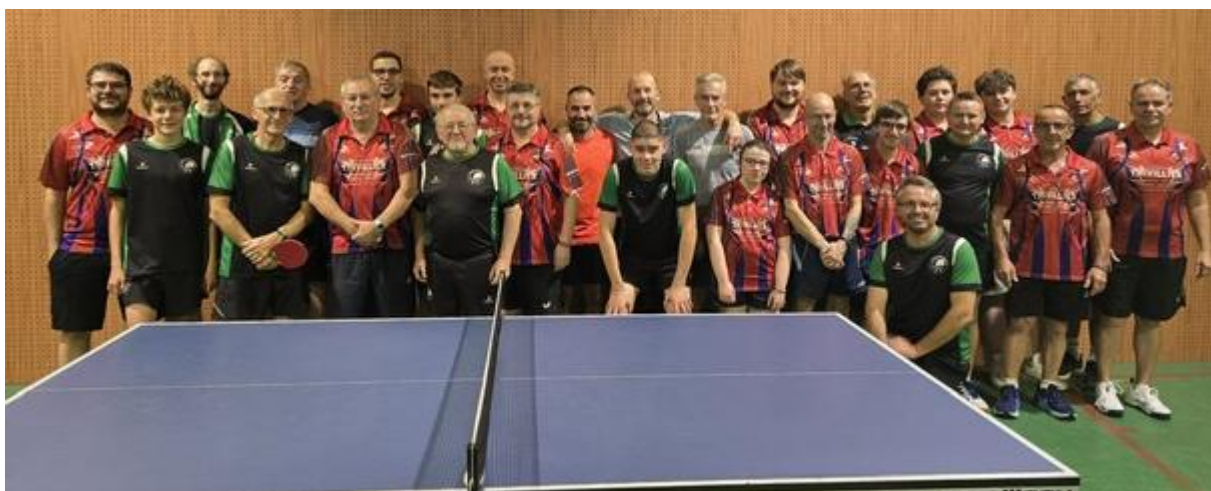
Les participants au match amical

Notre club organisera son 30ème tournoi annuel de tennis de table, ouvert à tous le samedi 20 décembre.