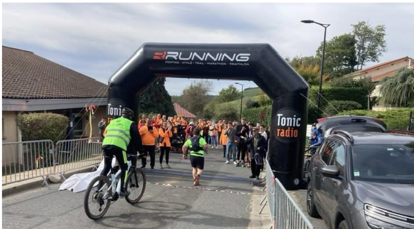
Arrivée du dernier coureur, encouragé par tous les bénévoles et spectateurs.

A l'occasion de la fête des Lumières, envoyez-nous votre plus beau cliché de lumignons (à mairie@souzy.fr ). La CCMDL souhaite mettre en valeur chacune des 32 communes à cette occasion