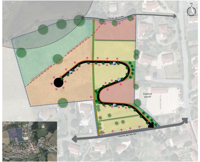
Schéma de principe (les tracés et positionnement des voies, équipements et espaces publics, programmes... à créer sont indicatifs)

Par mail, à l'adresse suivante : enquetepublique.plu.souzy@gmail.com.